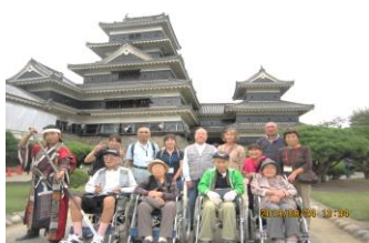
松本城へ外出訓練

社協本部内にある通所介護事業所「ふれあいの園」では広々とした開放的な広間を使っての体操、レクリエーション、寿司昼食会、地域のボランティアさんによる演芸を鑑賞したり日々様々な活動が繰り広げられています。