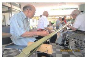
夏は流しそうめん