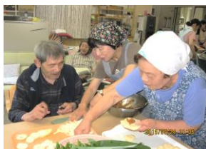
地産地消の笹おやき