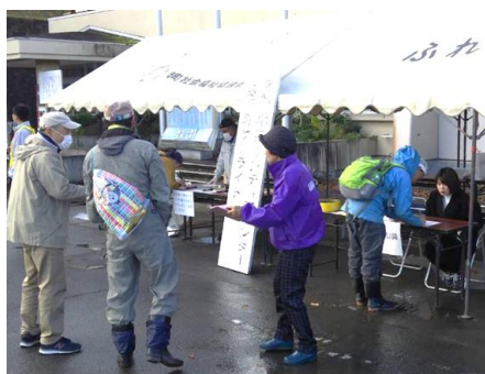
【ボランティア連絡会による受付の様子】