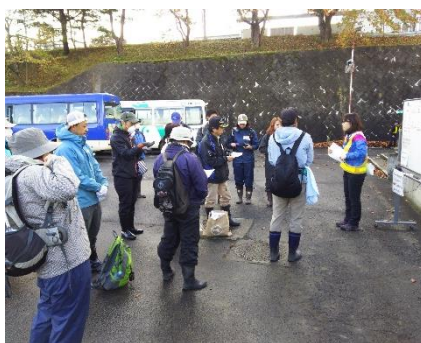
【ボランティア活動者への事前説明の様子】