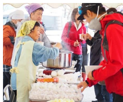
【三水消費者の会による炊き出しの様子】