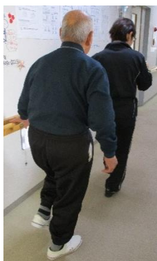
個別機能訓練実施中！

社協本部の横に隣接するりんごパークは、マシントレーニングを中心に、身体機能低下予防の体操・脳トレ等を組み合わせたプログラムで効果を引き出す機能訓練半日型デイサービスです。