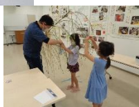
てんぐカフェ 七夕飾り作り