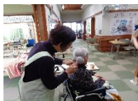
ご利用者さんの ドライヤーかけ