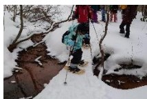
があたく塾 スノーシュー体験