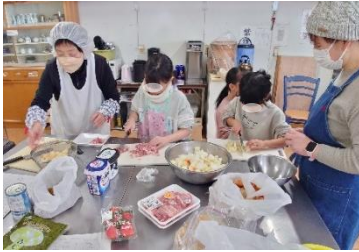
この日は、子どもたちと一緒にカレーライスを作りました♪